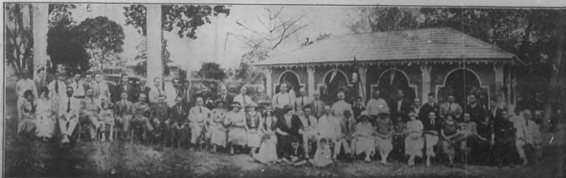
Un aspecto de la selecta concurrencia que asistió a la inauguración de los nuevos terrenos del "Club de Cazadores del Cerro".

Conocido comerciante y distinguido "sportman", Presidente del "Club de Cazadores del Cerro".