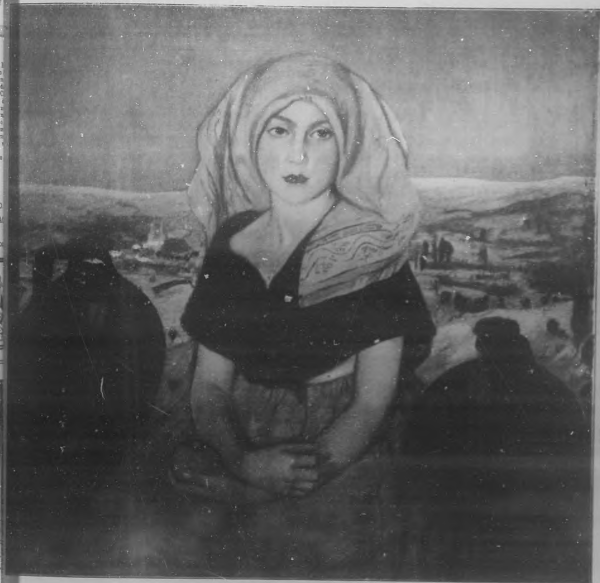
SERRANILLA Oleo por Pinazo Martínez.