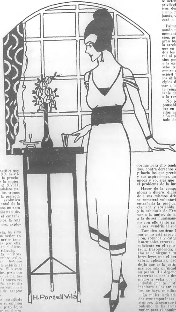
La mujer iguala al hombre en cultura e inteligencia.

Yo leo, copio y como Pilatos... me lavo las manos.— Roger de Lauria.