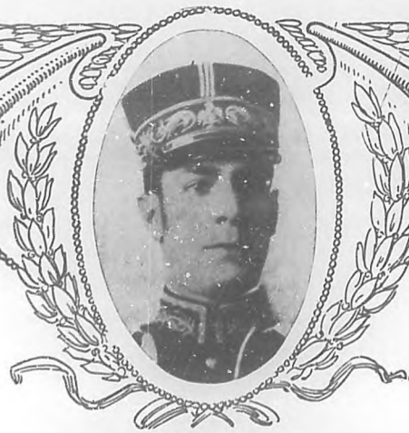
HUMBERTO BARROS Notable poeta mexicano, que reside actualmente en la Habana.