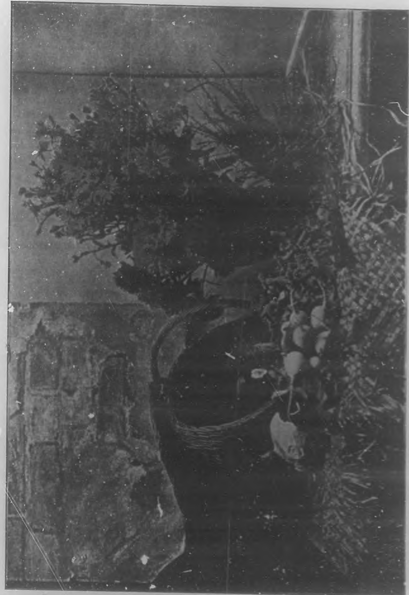
(Grabado tricolor de BOHEMIA.)