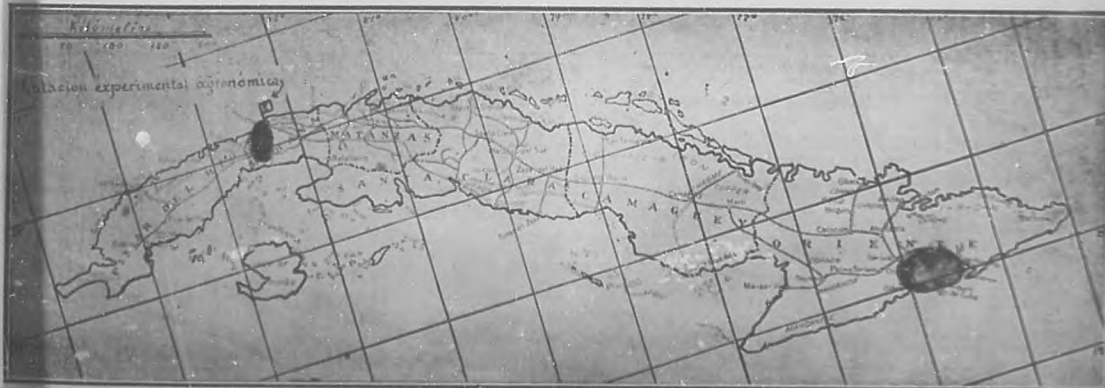
Mapa de Cuba en el que aparecen indicadas las dos zonas atacadas por la mosca prieta.