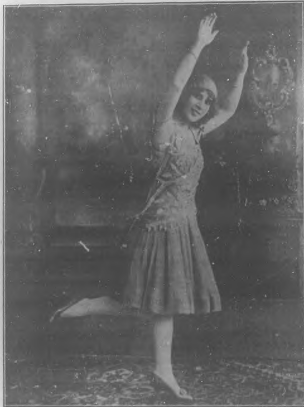
ENCARNACION LOPEZ, (LA ARGENTINITA) Bella y aplaudida artista de variedades que debutará el miércoles en el teatro "Capitolio".

El éxito obtenido nos hace creer que tendremos largo tiempo en el cartel de "Capitolio", La Dama de las Camelias.