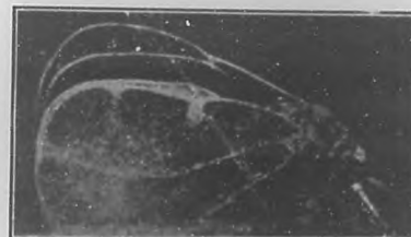
Un ejemplar de mosca prieta muy aumentado.